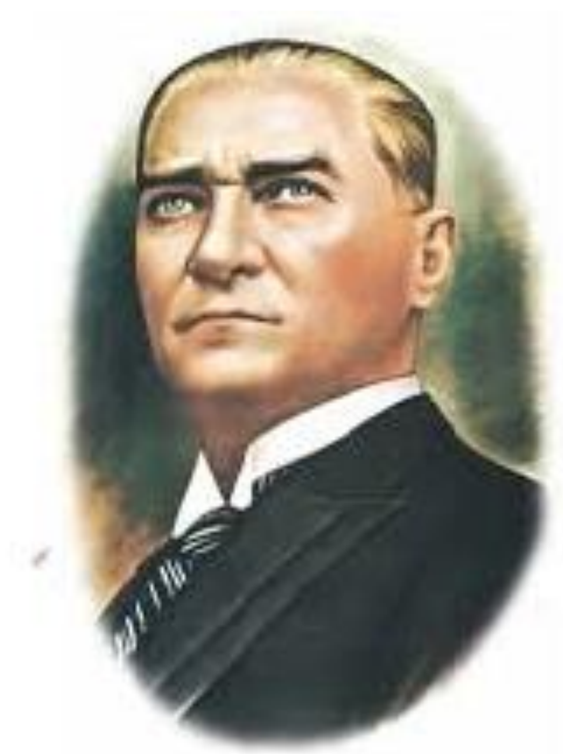
Gazi Mustafa Kemal ATATÜRK