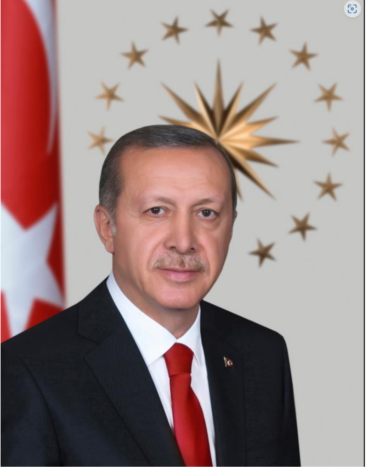
Cumhurbaşkanımız Recep Tayyip ERDOĞAN